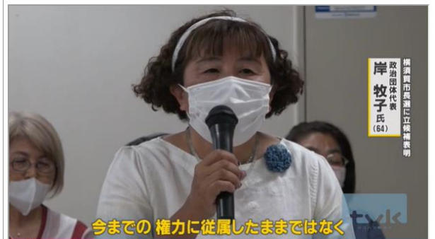
今までの権力に従属したままではなく