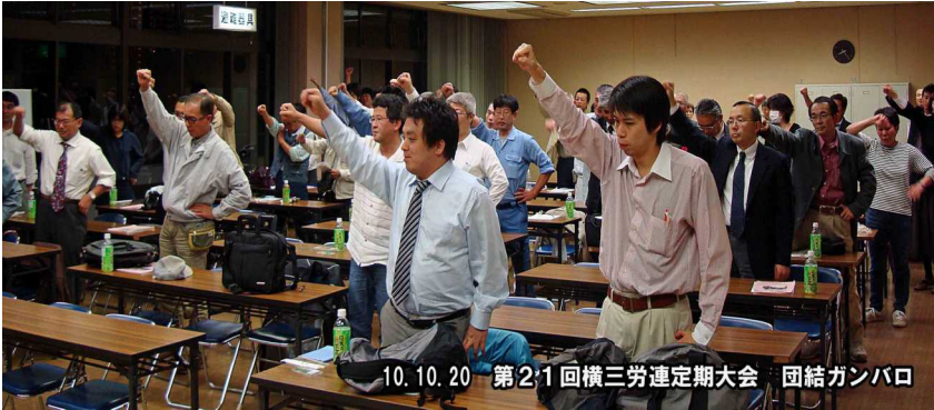
10.10.20 第21回横三労連定期大会 団結カンパロ